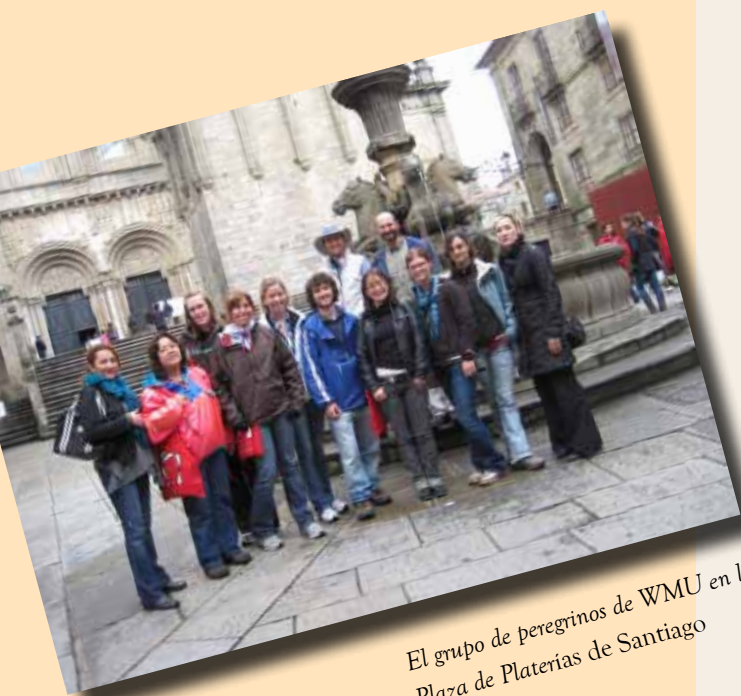
El grupo de peregrinos de WMU en la Plaza de Platerías de Santiago

Los dos días finales de descanso en Santiago sirvieron para que la experiencia vivida -satisfacción y sufrimiento-, por intensa, comenzara a posar en la memoria y a alimentar toda una vida de recuerdos, lo que serán aventuras del mañana y heroicas proezas de la madura imaginación. Y cuidado no cuestionar la poderosa fantasía del peregrino que ha caminado en año santo.