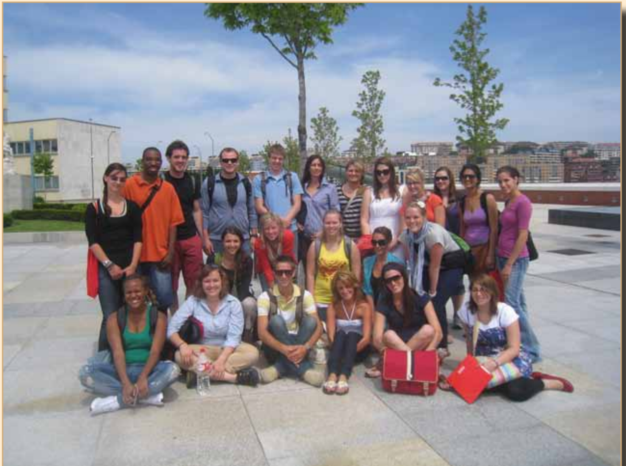
Grupo de Santander 2010, Universidad de Cantabria